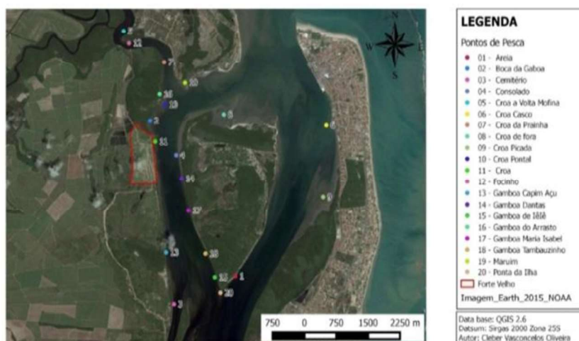
Figura 4. Localização dos Pontos de Pesca no Estuário do Rio Paraíba.

quanto ao uso compartilhado desses espaços de pescas pelas demais comunidades de pescadores. O critério de escolha dos pesqueiros atende às condições climáticas e do período em que eventualmente as espécies fazem-se mais presentes em determinado local (se na Croa, no meio do rio, juntos às Gamboas ou dentro do manguezal). A tomada de decisão e as estratégias empreendidas pelos pescadores obedecem estritamente ao Conhecimento Ecológico Local (CEL) (se a maré está calma ou agitada, se faz vento, se está nublado, se faz sol, condição lunar etc.) sobre as espécies e também a cooperação partida da indicação de outros pescadores.