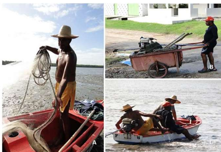
Figura 3. Organização e preparação para a pesca. (A) pescador preparando a rede, (B) Carrinho artesanal trazendo os equipamentos e petrechos de pesca, (C) Caico preparado e pescadores zarpando para a pescaria diária.