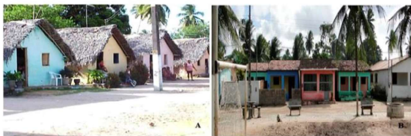
Figura 2. Evolução do perfil das casas dos moradores de Forte Velho. Perfil dos imóveis até década de 1990 (B) imóveis coloridos em alvenaria a partir de 2000 (A).

alcançar 59,5%. Não obstante o rendimento familiar reduzido, foram identificados melhorias nas construções dos imóveis, hoje representando 93,5% erguidas em alvenaria (Figura 2).